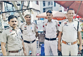
जींद। शहर में तैनात पुलिसकर्मियों।

त्योहारों का सीजन के मध्यनजर जिला पुलिस ने सतर्कता को बढ़ा दिया है। पूरे जिले में सुरक्षा के बेहद कड़े प्रबंध किए हैं। भीड़-भाड़ वाले इलाकों में विशेष चौकसी बरती जा रही है। पैदल गश्त के साथ राइडर, पेट्रोलिंग पार्टियों को भी लगाया गया है। भीड़भाड़ वाले इलाकों में सादे कपड़ों में पुलिस तथा महिलाकर्मियों को तैनात किया गया है। त्योहारों के