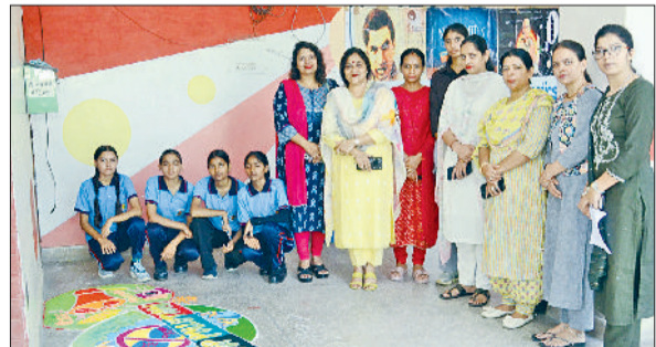
जींद। छात्राओं द्वारा बनाई गई रंगोली।