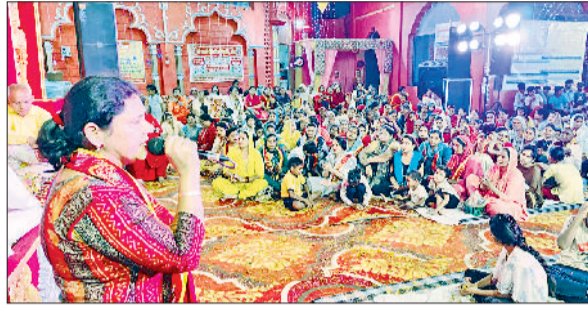
जींद। जयंती देवी मंदिर में आयोजित जागरण में मां की भेंटें सुनाते हुए कलाकार।

जयंती देवी मंदिर में सोमवार को अल सुबह से ही श्रद्धालुओं की लंबी लाइन लगनी शुरू हो गई थी। दिन निकलते-निकलते मंदिर परिसर में हजारों की संख्या में श्रद्धालु जमा हो गए तथा चारों तरफ मां भगवती के जयकार गूंजने लगे। यह क्रम रात तक जारी रहा। श्रद्धालुओं की भीड़ के कारण मंदिर के सामने कई बार जाम की स्थिति बन गई। दिनभर श्रद्धालुओं का आवागमन पूजा अर्चना के मंदिर परिसर में लगा रहा। मेले का हुआ आयोजन, श्रद्धालुओं ने जमकर खरीददारी: दुर्गा सप्तमी को देखते