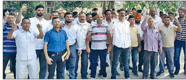
सीवान। बिजली बोर्ड प्रांगण में नारेबाजी करते कर्मचारी।