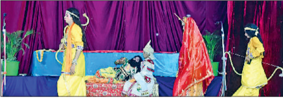
गुहला चौका। राम, लक्ष्मण और सीता के वनगमन का दृश्य प्रस्तुत करते कलाकार।

प्राचीन श्री मां भवानी मंदिर चौका के प्रांगण में चल रहे श्रीराम लीला महोत्सव के अंतर्गत राम वनवास की लीला का मंचन बड़े ही भावुक और भव्य स्वरूप में किया गया। अयोध्या एवं श्री वृंदावन धाम से आए कलाकारों की प्रस्तुति ने दर्शकों को भाव विभोर कर दिया। जैसे ही राम, सीता और लक्ष्मण के वनगमन का दृश्य मंच पर आया, पंडाल 'जय श्रीराम' के उद्घोष से