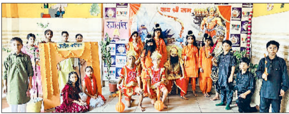
कैथल। रामलीला मनाते गायत्री स्कूल के विद्यार्थी।

गुंजा उठा। आज की लीला में मंथरा द्वारा कैकई को उकसाकर राम के राज्याभिषेक को रोकवाने और 14 वर्षों का वनवास मांगने की कथा का भावपूर्ण मंचन किया गया। राजा दशरथ की पीड़ा और राम के त्याग को देखकर दर्शकों की आंखें नम हो गईं। लीला में दिखाया गया कि कैसे राम पिता की आज्ञा का