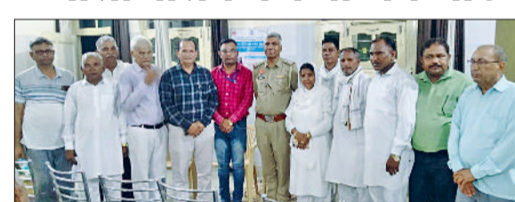
डॉ. भीमराव अम्बेडकर भवन में जनता को जागरूक करते पुलिस कर्मचारी