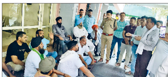
गुहला-चीका। मार्किट कमेटी कार्यालय के बाहर धरना देते किसान।